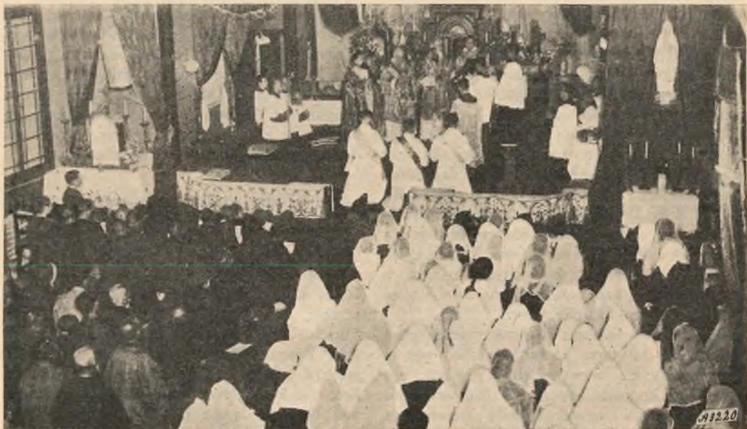
La cerimonia dell'Ordinazione sacerdotale.

Col personale venuto dall'Italia e quello indigeno in formazione speriamo d'ora in poi di avere annualmente qualche ordinazione sacerdotale. Il Missionario allora spinge il suo sguardo nell'avvenire e... pregusta il momento in cui, aumentato il numero degli operai della vigna, il raccolto potrà esser più abbondante. L'auspicarlo non è difficile: la formazione richiede tempo e mezzi, a cui deve pensare la Provvidenza e i suoi caritatevoli ministri; a noi l'eccitarla nelle forme possibili. Dalla prova fatta mi pare che si possa concludere che,