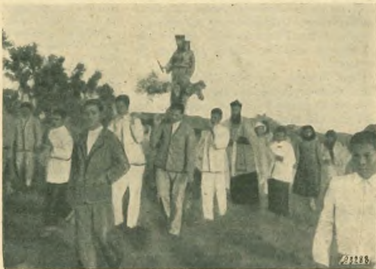
La processione di Maria Ausiliatrice a Curiara.

Dando alle funzioni la maggior solennità che potremmo, celebriamo il mese di Maria con canti e sermoncini tutte le sere. La popo-