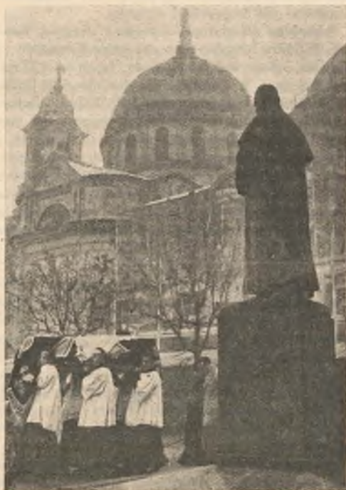
La bara passa dinanzi al monumento di Don Bosco nel cortile interno dell'Oratorio, a lato del Santuario.

Alassio, Este, Ascona furono i campi del suo primo apostolato di salesiano, e l'additarono per la Direzione dell'Istituto Pareggiato di Bronte in Sicilia, ove stette, come Direttore ed Insegnante, dal 1897 al 1910, mentre già la fiducia dei Superiori l'aveva elevato ad Ispettore delle Case di Sicilia. Con questo stesso ufficio passò in seguito a Sampierdarena, come Ispettore delle Case di Liguria, Toscana ed Emilia. Infine, fattasi vacante nel 1919 la carica di Consigliere Scolastico nel Capitolo Superiore, Don Albera ve lo chiamò per la Direzione generale degli Studi e della Stampa salesiana: carica confermatagli con plebiscitarie votazioni nei Capitoli Generali susseguenti.