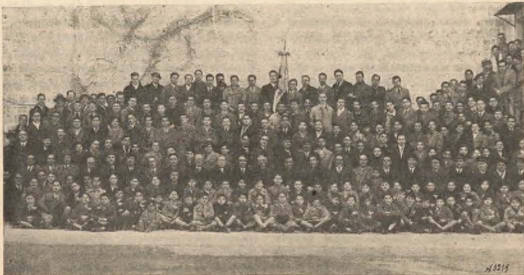
Napoli - Vomero. - Fioritura di Azione Cattolica nell'Oratorio Salesiano.

Papa è Papa per tutti, e tutti devono immensamente al suo zelo paterno. Ma, per noi, Pio XI è anche il « Papa di Don Bosco », che ci ha allietato della gioia ineffabile della beatificazione e della canonizzazione del nostro Fondatore. Per questo il Rettor Maggiore ha voluto che la festa liturgica di San Giovanni Bosco fosse quest'anno offerta, nella Basilica di Maria Ausiliatrice, tutta quanta pel Papa. Giovani, Cooperatori e parrocchiani hanno risposto all'appello con slancio filiale. Dal mattino alla sera fu un succedersi di preghiere e di comunioni, di sante messe e di solenni funzioni per ottenere dal Signore, ad intercessione del Santo, il miracolo, se occorre, della sollecita guarigione del Vicario di Cristo. Ma il fervore di quel giorno non deve più scemare finchè non abbiamo ottenuto la grazia sospirata, secondo la volontà di Dio. In tutte le nostre Case si continuano preghiere speciali indette espressamente dal signor Don Ricaldone nella sua circolare del 24 gennaio u. s. Cooperatori e Cooperatrici si uniscano nello stesso intento; ed il Santo Fondatore offra gradite a Dio le comuni preghiere di tutta la famiglia salesiana, implorando, pel tramite della Vergine Santa Ausiliatrice, quella pienezza di salute e di forze che permettano al Santo Padre di riprendere l'attività preziosa del suo glorioso pontificato, oggi quanto mai necessaria all'orientamento dei buoni, alla salvezza del mondo.