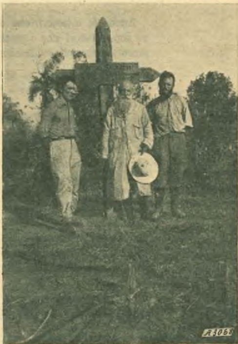
Appena collocata la croce sul luogo dell'eccidio.

Una mossa del timone, e l'imbarcazione s'accostò alla riva. Osservarono attentamente; sull'orlo del fiume, sotto i folti rami che si curvavano fin sopra l'acqua, stavano ancora alcuni fasci di rami che legati con liane e cortecce di